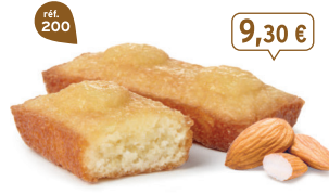
FINANCIERS AMANDES 30 emballages individuels - 660 g - 14,09 €/kg DDM* : 2 mois