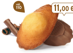
MADELEINES CHOCOLAIT 50 emballages individuels - 1080 g - 10,19 €/kg DDM* : 2 mois