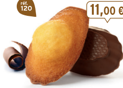
MADELEINES CHOCONOIR 50 emballages individuels - 1080 g - 10,19 €/kg DDM* : 2 mois