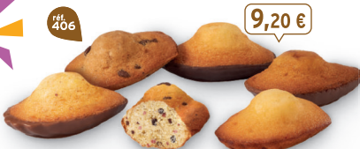
FARANDOLE DE MADELEINES 30 emballages individuels - 595 g - 15,46 €/kg 5 Madeleines ChocoNoir - 5 Madeleines Pépites - 5 Madeleines Citron - 5 Madeleines Noisette Chocolait - 5 Madeleines Framboise Pépites - 5 Madeleines Caramel Chocolait DDM* : 2 mois