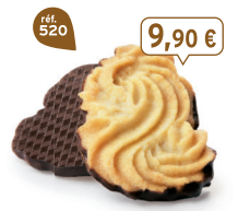
SABLÉS VIENNOIS 32 étuis de 2 - 620 g - 15,97 €/kg DDM* : 2 mois