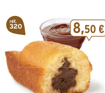
BIJOU CACAO 20 emballages individuels - 660 g - 12,88 €/kg DDM* : 2 mois