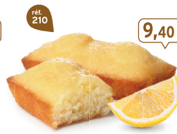
FONDANTS CITRON 30 emballages individuels - 660 g - 14,24 €/kg DDM* : 2 mois