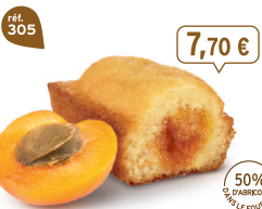
BIJOU ABRICOT 20 emballages individuels - 660 g - 11,67 €/kg DDM* : 2 mois