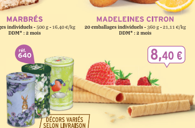
COFFRET BRINS FRAISE ET FRAISE DES BOIS 6 étuis de 7 - 300 g - 28,00 €/kg DDM* : 5 mois