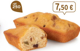
CAKES FRUITS 20 emballages individuels - 600 g - 12,50 €/kg DDM* : 2 mois