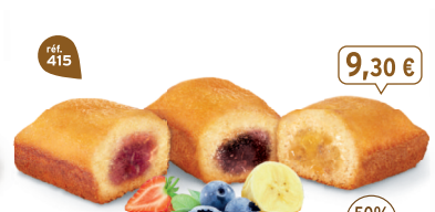
PANACHÉ DE BIJOU FRUITS 30 emballages individuels - 990 g - 9,39 €/kg 10 Bijou Fraise, 10 Bijou Myrtille, 10 Bijou Banane DDM* : 2 mois