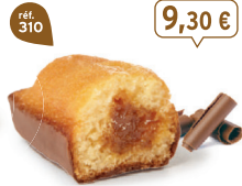
BIJOU Caramel CHOCOLAIT 20 emballages individuels - 740 g - 18,57 €/kg DDM* : 2 mois