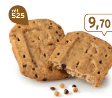
P'TIT-DEJ CHOCOCROUSTILL' 24 étuis de 2 - 670 g - 14,48 €/kg DDM* : 5 mois