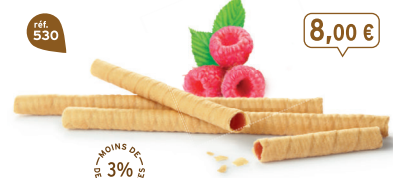
BRINS FRAMBOISE 7 étuis de 7 - 425 g - 18,82 €/kg DDM* : 5 mois