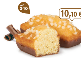
GÉNOIS CHOCOLAIT 30 emballages individuels - 920 g - 10,98 €/kg DDM* : 2 mois