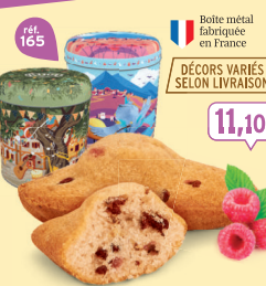
COFFRET MADELEINES FRAMBOISE PÉPITES 18 emballages individuels - 324 g - 34,26 €/kg DDM* : 2 mois