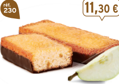
LINGOTS POIRE CHOCONOIR 25 emballages individuels - 675 g - 16,74 €/kg DDM* : 2 mois