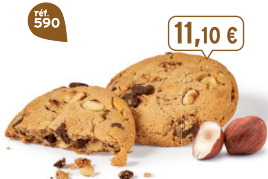
TRÉSOR NOISETTECHOCO 18 étuis de 2 - 585 g - 18,97 €/kg DDM* : 5 mois