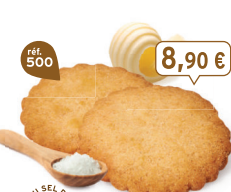
GALETTES 48 étuis de 2 - 450 g - 17,33 €/kg DDM* : 5 mois