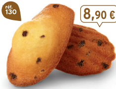
MADELEINES PÉPITES 50 emballages individuels - 900 g - 9,89 €/kg DDM* : 2 mois