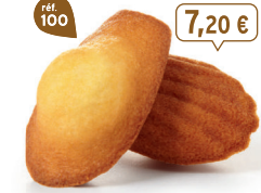
MADELEINES NATURE 50 emballages individuels - 880 g - 8,18 €/kg DDM* : 2 mois