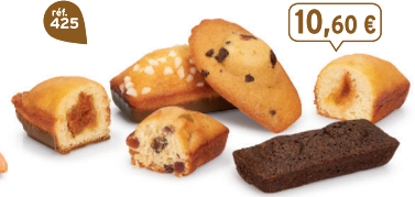
BOUQUET DE PÂTISSERIES 30 emballages individuels - 850 g - 12,47 €/kg 5 Madeleines Pépites - 5 Géniois Chocolait - 5 Bijou Caramel Chocolait 5 Bijou Pêche - 5 Melleux Chocolait - 5 Cakes Fruits DDM* : 2 mois