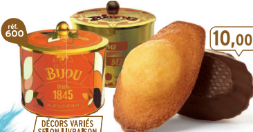
BOÎTE COLLECTOR MADELEINES CHOCONOIR 12 emballages individuels - 260 g - 38,46 €/kg DDM* : 2 mois