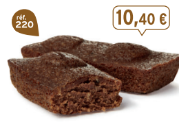
MËLLEUX CHOCOLAIT 30 emballages individuels - 660 g - 15,70 €/kg DDM* : 2 mois