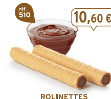
ROLINETTES CHOCONOISETTES 45 étuis de 2 - 575 g - 18,43 €/kg DDM* : 5 mois