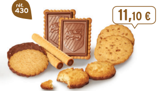
MÉLI-MÉLO DE BISCUITS 46 étuis de 2 - 900 g - 12,33 €/kg 8 étuis de 2 Rolinettes ChocoNoisettes - 10 étuis de 2 Craquants Cocolait 10 étuis de 2 ChocoSables - 10 étuis de 2 Galettes Caramel d'Isigny 8 étuis de 2 Petits-Beurre Tablette Chocolait DDM* : 5 mois